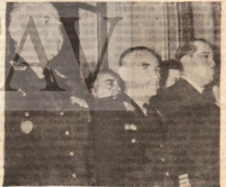
Peru'yu yöneten cuntanın başları Geç kalan reform müadileri

Meksika da sınırlı içerisinde bulunan ülkelerden biri. İktisaden geri kalmışlığına rağmen, içerisinde, gericiyle ilericiyle çekişme var. Cozayir Kurtuluş hareketini düzenleyen Milli Kurtuluş Cephesi benzeri bir teşkilât — Milli Kurtuluş Hareketi — siyasi faaliyet gös