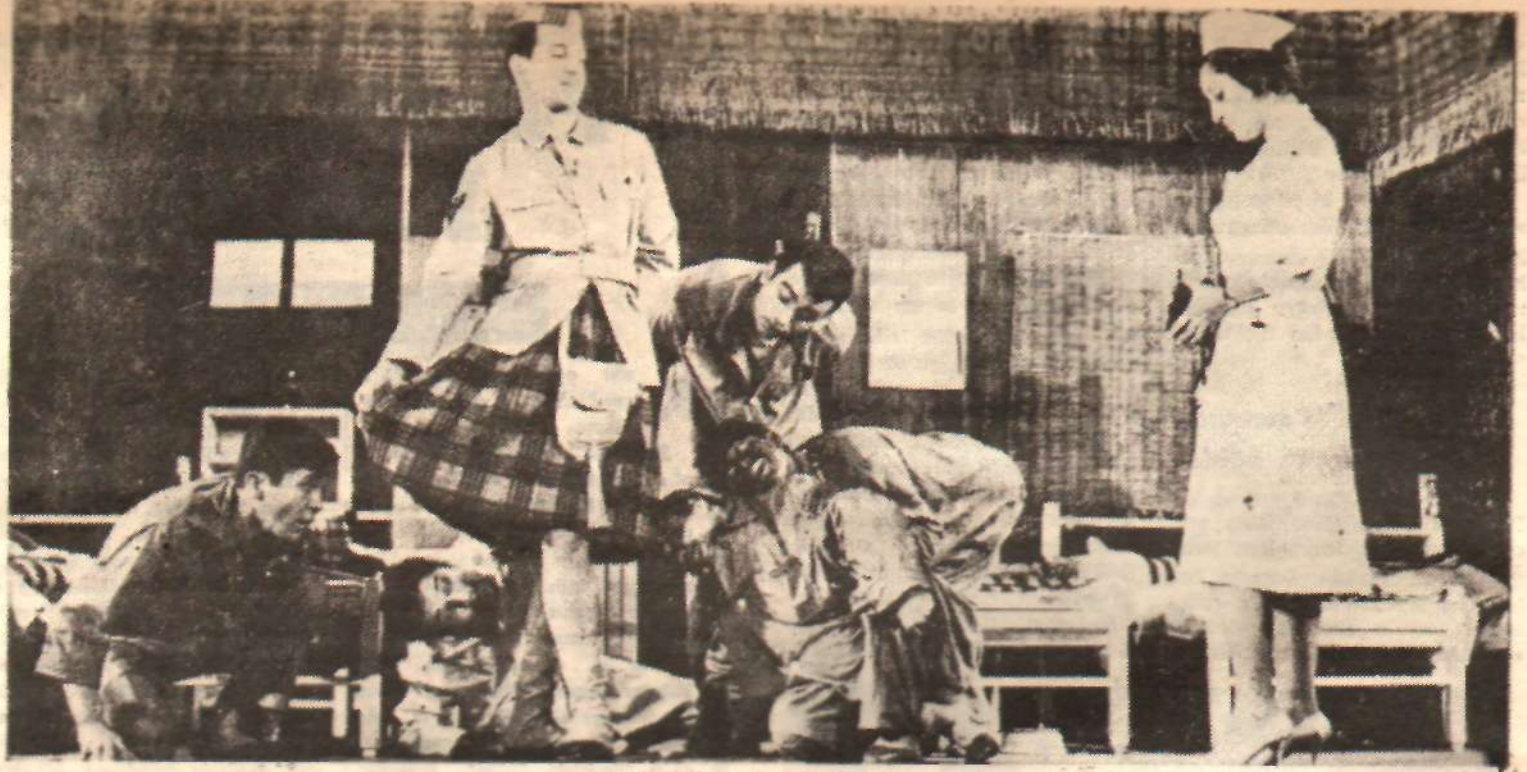
«Aceleci Kalb»ten bir sahne