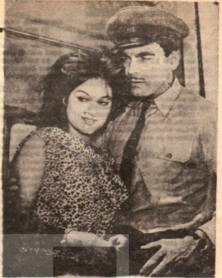
Türkân Şoray — Ayhan Işık Ağaların İstedığı

Mesele, kömür veya çelik istisali gibi, ekonomik açıdan ele alınırsa, Türk Sinemasının son yıllarda çok büyük bir gelişme gösterdiği muhakkak... Türk kapitalizminin en önemli kollarından biri de sinema endüstrisi. Yalnız bu tesirli kütle sanatı, kendinden beklenen görevleri yerine getirebiliyor mu, atıremiyorsa neden? Sinemada devletçilik bir çözüm yolu olabilir mi? Bülent HABORA'nın yazısını, bu meselede tartışmalara yol açmak ümidiyle yayınlıyoruz. YÖN, Sinema çevrelerinin konuyla ilgili görüşlerini sevinçle yayınlıyacaktır.